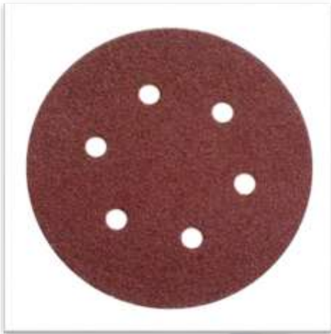
DISCO VELCRO 125