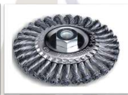
CEPILLO CIRCULAR TRENZADO