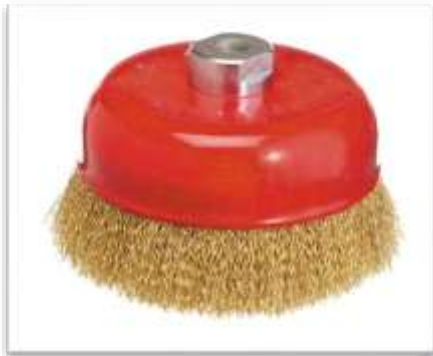
CEPILLO TAZA ONDULADO

65MM Ref: TO65 75MM Ref: TO75 100MM Ref: TO100