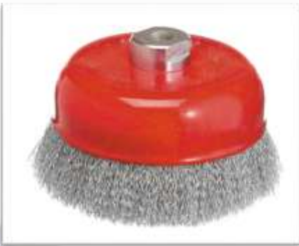
CEPILLO TAZA ONDULADO INOX

65MM Ref: TO65 75MM Ref: TO75 100MM Ref: TO100