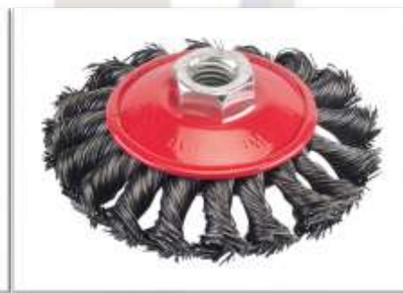
CEPILLO CÓNICO TRENZADO

100MM Ref: CVT100 INOX 100MM Ref: CVTI100