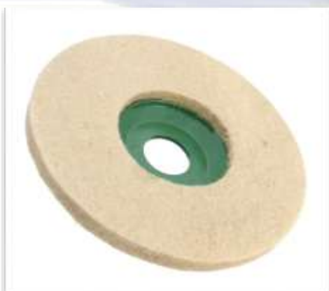
DISCO DE PULIR FILTRO LANA 115