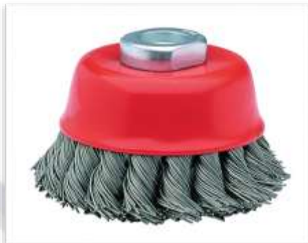
CEPILLO TAZA TRENZADO

65MM Ref: TT65 75MM Ref: TT75 100MM Ref: TT100