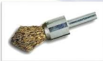
CEPILLO BROCHA PUNTA CON EJE

100MM Ref: CVT100 INOX 100MM Ref: CVTI100