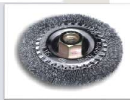
CEPILLO CIRCULAR INOX