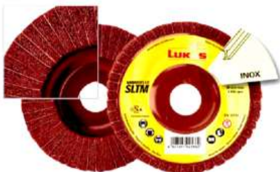
DISCO VELLÓN + TELA ABRASIVA