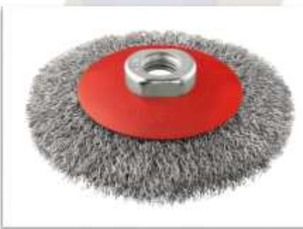
CEPILLO CÓNICO INOX